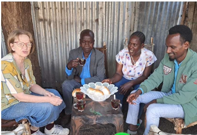
Tee- ja kahvituolla tiimin kanssa Arba Minchissä.

Arba Minchissä vietimme tiimin kanssa tiiviit viikot pitkin päivineen, välilauantaikin meni työskennellessä 2. Mooseksen kirjan parissa. Välillä katsoimme kuvia kirjan ohjeiden mukaan rakennetusta pyhäkköteltasta, siihen kuuluvista esineistä sekä ylipappi Aaronin ja poikiensa puvuista tehtyjä videoita ja kuvia ja sitten taas työstimme diraitan tekstiä. Paljon aikaa meni sanaston kanssa painimiseen. Yksi käänösongelmista oli se, että diraitan kielessä ei ole sanaa ”alttari”. Niinpä sen kääntämiseen piti käyttää kuvailevia lausekkeita: polttouhrialttari = iyyaan laaqq dhoohiyy uqqari dhehaan niyya (se, minkä päälle poltettava uhri tuodaan) ja suitsutusuhrialttari = Iyyaan hithaanat uqqari aarsamiyyu (se, minkä päällä poltetaan suitsuketta).