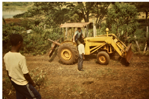
Tien tekoa Dembi Dollossa 1990-luvulla.

Jos taas laitamme Valtakunnan asiat ensimmäisiksi, elämästämme tulee kiipeämistä ylöspäin. Joka päivä matkaamme oman Karmelimme huippua kohti. Lopulta, vaikka tuulispää ei viekään meitä kotiin, niin joko enkelit tai itse Herramme kutsuu meidät luokseen yläilmoihin. Emme silloin ole pahoillamme, että valitsimme Karmelin. (käännös Mirjamin)