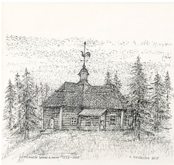
Taiteilijan näkemys Sotkamon neljänestä kirkosta. Kirkko tunnetaan kukkoviiri-kirkkona.